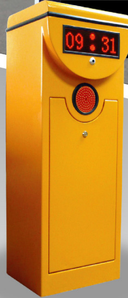
CMPC001 LED carpark Straight Boom, 3s, 4.5m