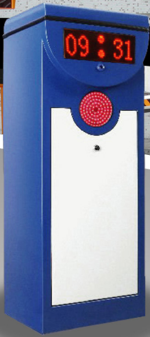
CMP5113 LED carpark Straight Boom, 4m